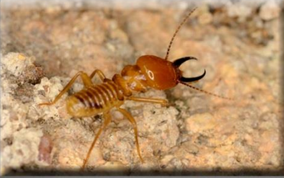
ಕಾಲೇ ರಿವಿ-ತಲೆಯೇ ಕಹಳೆ !