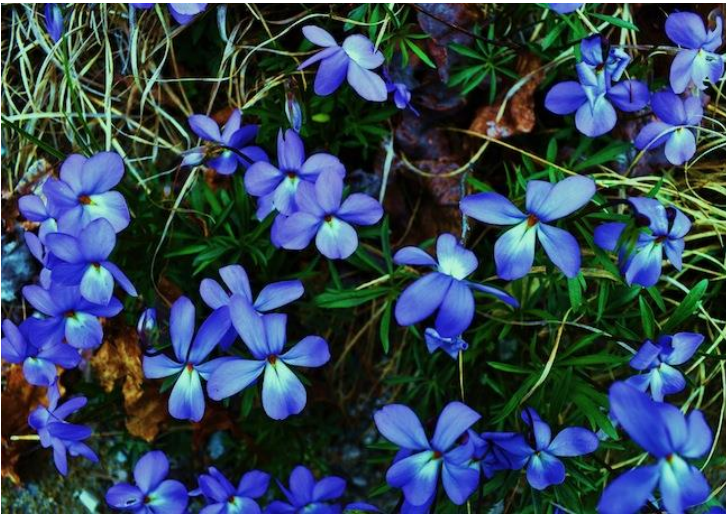
"ಬರ್ಡ್ ಫ್ಲೈಟ್ ವೈಲೆಟ್" ಹೂಗಳು

ಏತಕ್ಕೆ ಒಂದೇ ಹೂ ನಲ್ಲಿ ಎರಡೆರಡು ಬಣ್ಣಗಳು? ಸಿಂಗರಿಸುವುದಕ್ಕಾ...? ಅಲ್ಲ... ಮಾನವರಿಗಿಂತ ಸಾವಿರಾರು ವರುಷಗಳ ಮುಂಚೆಯೇ ಭೂಮಿಗಿಳಿದವು ಸಸ್ಯಗಳು. ಇತ್ತೀಚೆಗೆ ಬಂದ ಎಳೆ ಕೂಸು ನಾವು. ನಮಗಾಗಿ ಅಲ್ಲ ಇದು. ಹಾಗಾದರೆ ಇನ್ನೇನು ಕಾರಣ?ಒಂದು, ಸಾಮಾನ್ಯವಾಗಿ ಎಲ್ಲರೂ ಹೇಳುವಂತೆ ಕೀಟಗಳನ್ನು ಆಕರ್ಷಿಸಲು ಇರಬಹುದು. ಹಾಗೆಯೇ ಈಚೆಗಿನ ಸಂಶೋಧನೆಯಲ್ಲಿ ಇದಕ್ಕೆ ಇನ್ನೊಂದು ಉತ್ತರ ಸಿಕ್ಕಿದೆ.