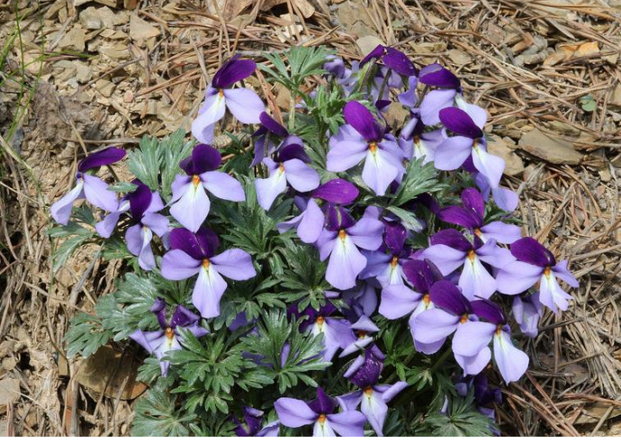
ಮೂರು ತೆಳು ನೇರಳೆ ಮತ್ತೆರೆಡು ಕಡು ನೇರಳೆ

ನೇರಳೆ ಬಣ್ಣದ್ದು. ಈ ಬೇರೆ ಬೇರೆ ಬಣ್ಣಗಳಿಂದ ಇವೆರೆಡು ಹೂಗಳಿಗೂ ಏನು ಉಪಯೋಗ ಇರಬಹುದು ಎಂದು ಸ್ವಲ್ಪ ವಿಜ್ಞಾನಿಗಳು ತಲೆ ಕೆಡಿಸಿಕೊಂಡು ಒಂದು ಉತ್ತರವನ್ನು ಸಹ ಕಂಡುಕೊಂಡಿದ್ದಾರೆ.