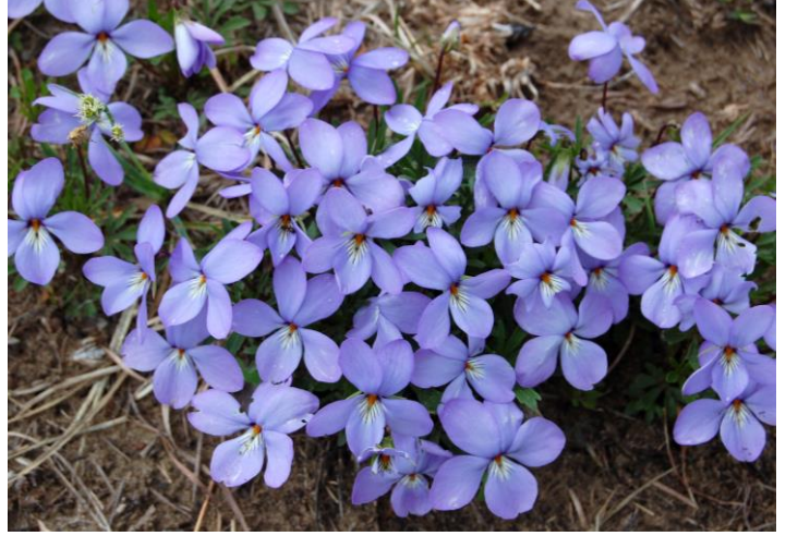
ಐದೂ ತೆಳು ನೇರಳೆ ಬಣ್ಣದ ದಳಗಳು